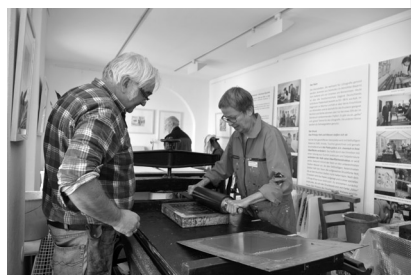
Heinrich Blunck, Winterabend/Allgäu